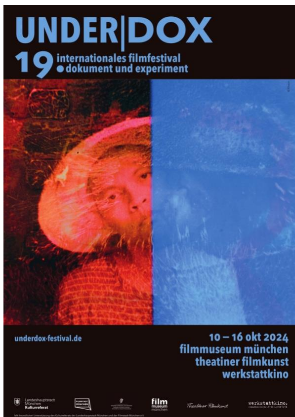
Plakatmotiv 2024: This is not the artist in focus (Khavn)