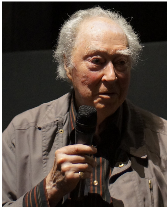
Michael Snow im Filmmuseum München am 23.5.2014

Das Bild eines inszenierten Ereignisses, das in zwei Hälften geteilt wurde, die jeweils übereinander gelegt wurden (Ton und Bild). Ein „Gemälde“ über ein Gemälde, in dem Vorher und Nachher zu einem transparenten Jetzt werden. Ankunft und Abreise sind vereint.