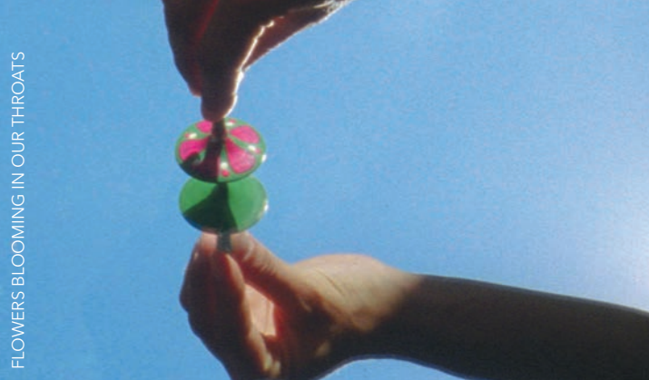
FLOWERS BLOOMING IN OUR THROATS